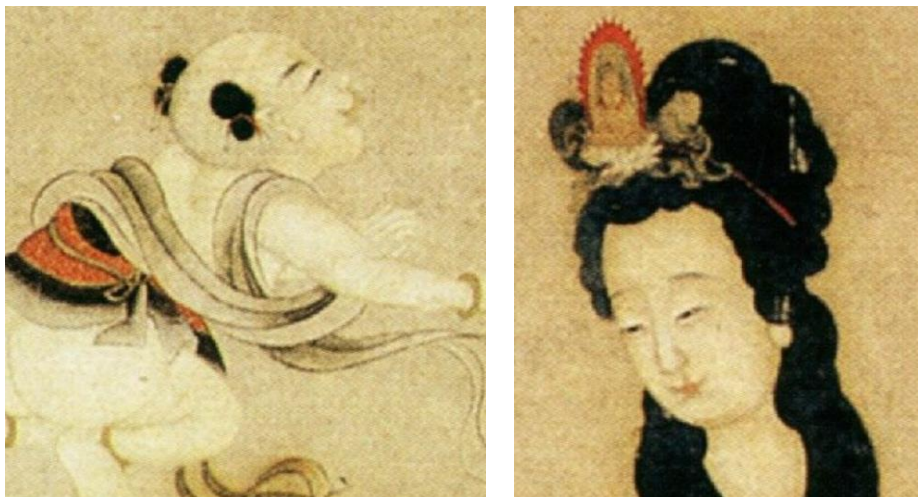
【圖 9】清，金禮羸《觀音圖》觀音與童子面部局部對照。