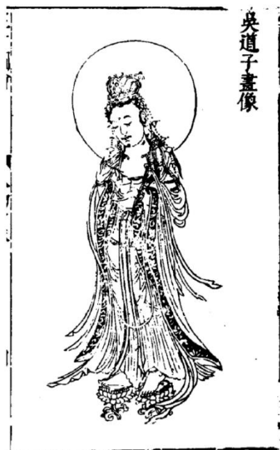
【圖 1】《三才圖會》中的吳道子繪觀音像。