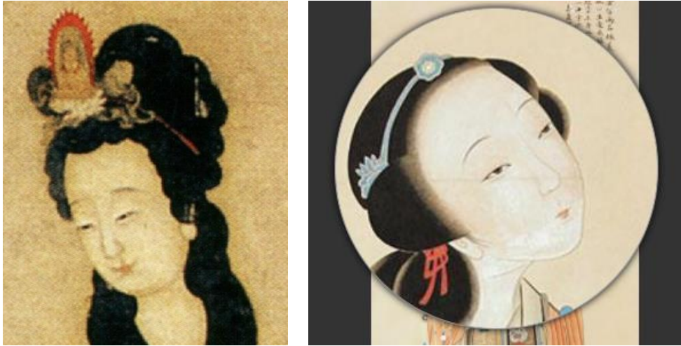
【圖 8】清，金禮羸《觀音圖》容貌局部與《綠珠小影》局部對照。