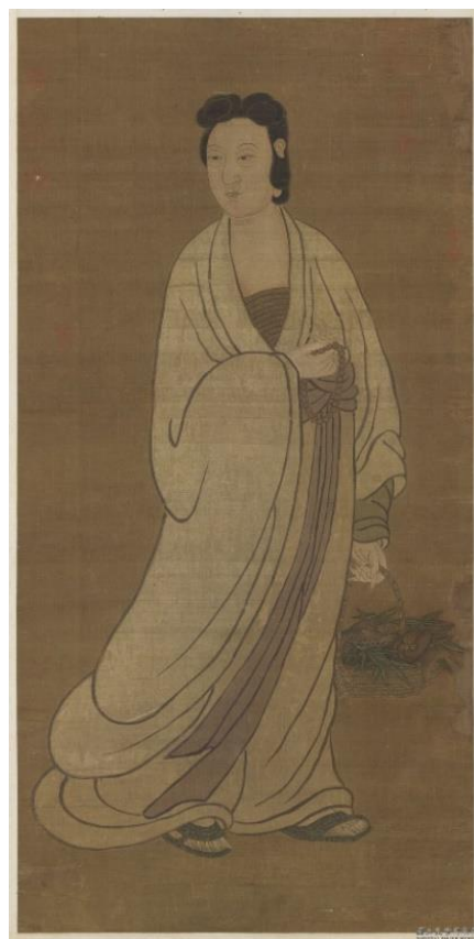
【圖 3】元，趙孟頫，《魚籃大士像》。