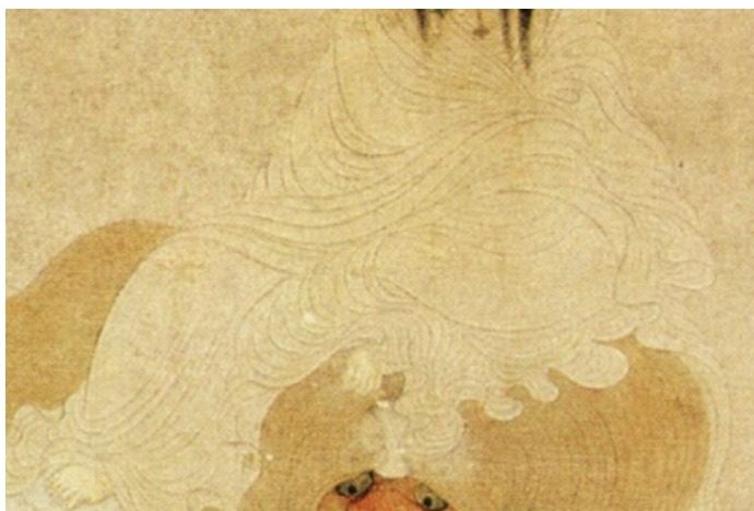
【圖 7】金禮羸，《觀音圖》白衣局部。