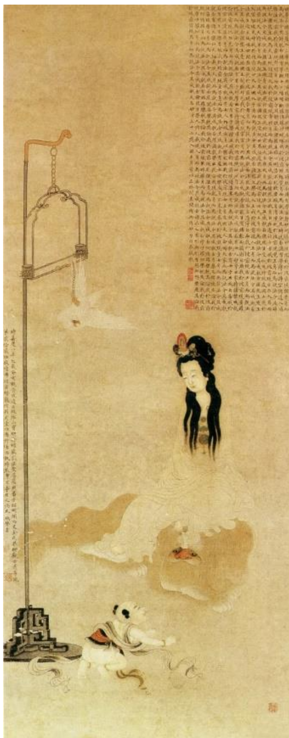
【圖4】清，金禮羸，《觀音圖》。